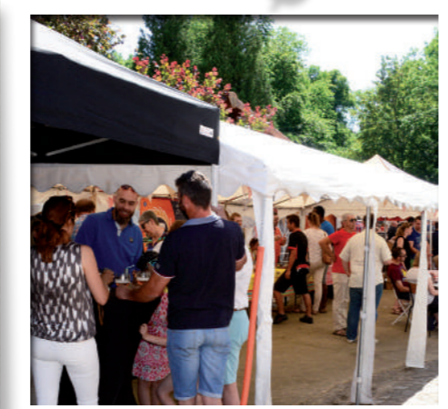
Juin: 2ème round pour le festival du Musée de la Bière qui confirme le succès de cette nouvelle animation.