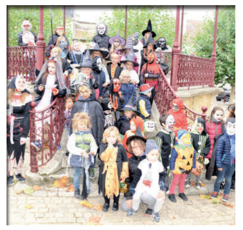
Les parents d'élèves, Les Diabolins, sont toujours aussi dynamiques pour animer l'année des enfants autour des grands moments du calendrier.