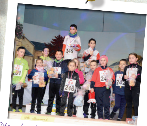
Décembre: La 6 ème édition des Foulées Stenaisiennes du Centre Social et Culturel reste un événement incontournable et célèbre tous les sportifs quelque soit leur âge.