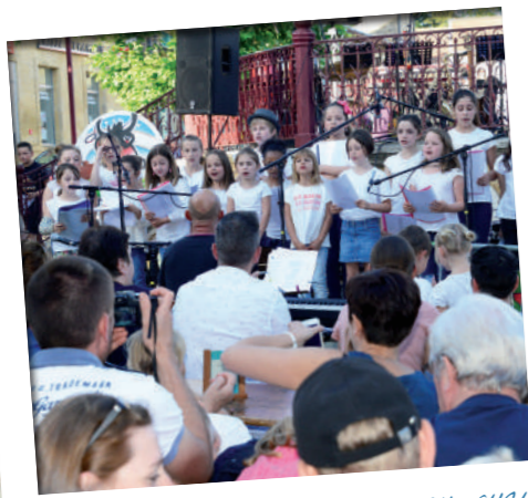
Juin: L'école de musique ne manque aucun rendez-vous de « Kiosque en Fête » de l'Office de Tourisme pour présenter le travail accompli dans l'année.