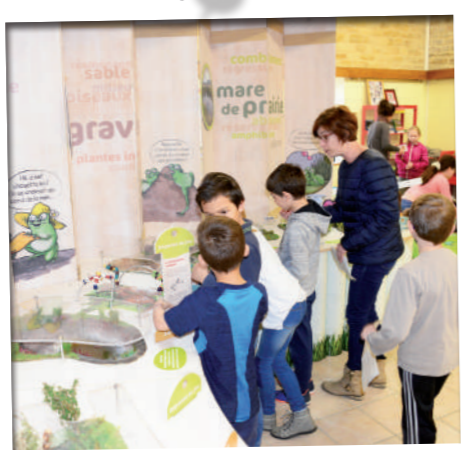
Avril: Les Zones humides et le patrimoine naturel de notre terroir sont mis à l'honneur pour promouvoir leur sauvegarde auprès des nouvelles générations.