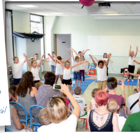
Juin: L'école primaire Albert Toussaint célèbre la fin de la l'année scolaire avec son concert et ses portes ouvertes. Un beau moment attendu par parents et enfants.