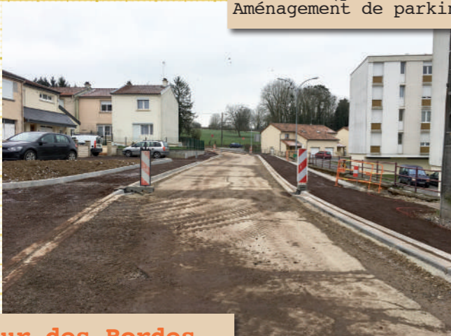
Rue des Rosiers et rue des Primevères : Réhabilitation des rues avec rénovation des bordures, de la chaussée. Création de deux aménagements de sécurité (plateaux surélevés). Aménagement de parking.

De nombreux travaux ont été entrepris à travers la ville : sécurité des piétons et des véhicules, accès aux personnes à mobilité réduite, esthétique... la ville s'embellit.