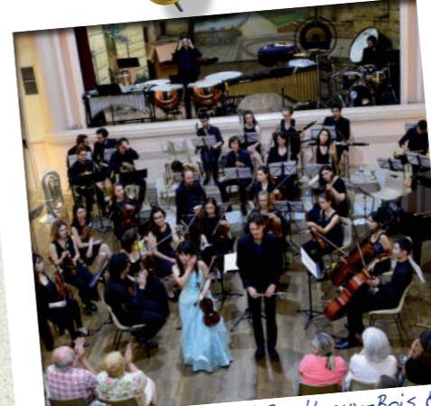
Juillet: Le festival « Boult-aux-Bois & Cordes » se produit à Stenay avec un concert dédié, sans oublier la formation Cuivres en Ardennes présente chaque été.

Une des richesses de Stenay et le nombre et le dynamisme de ses associations. Dans un monde où beaucoup de personnes s'enferment dans l'individuel, les associations avec leur sens du collectif, leur ouverture sur le monde à travers le sport, la culture, la solidarité... font la vie.