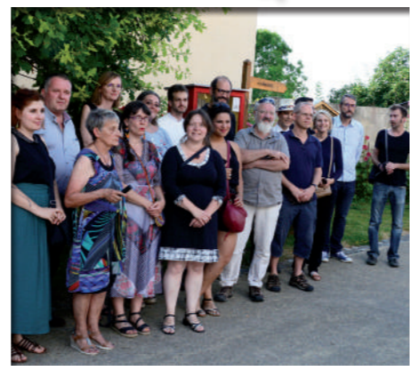
Juillet à Décembre: Les artistes du Nord meusien s'exposent au Musée de la Bière au travers d'un éclectique cabinet de curiosités « Inondation ».