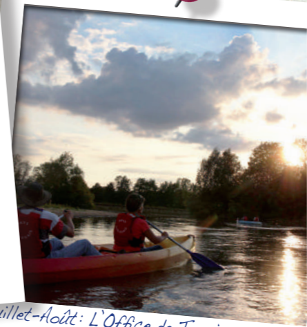
Juillet-Août: L'Office de Tourisme propose de découvrir les richesses naturelles de notre département autrement, au fil de l'eau avec les Rand'eau Meuse