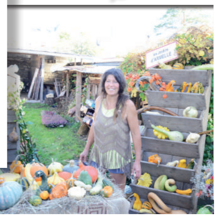
Octobre: La nature et ses produits sont eux aussi fêtés avec les Jardins d'Armelle et notamment lors du traditionnel marché d'automne.