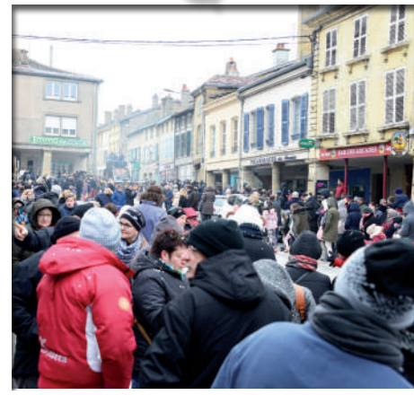
Mars: La saison d'animations démarre en fanfare avec le traditionnel carnaval de Stenay, 8ème édition.