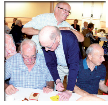
Tout au long de l'année, le Club Générations Loisirs est toujours très actif pour proposer sorties et animations aux séniors.