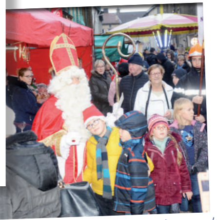
Décembre: Les Amis de Nicolas ont renouvelé leur grande fête en l'honneur du saint lorrain avec un public encore plus nombreux pour cette seconde édition.