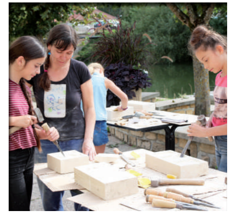
Septembre: Les Journées du Patrimoine sont aussi l'occasion d'être acteur de la manifestation et de se confronter aux métiers liés au patrimoine comme la sculpture.