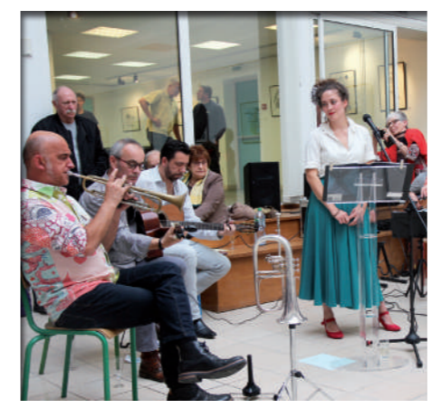
Octobre: Le 10 ème festival Ipoustégy mêle art, jazz et commémoration à l'occasion du Centenaire de la Victoire avec des Stenaisiens participant au succès de la manifestation.